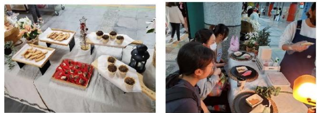
自主募課—材料費明細與照片